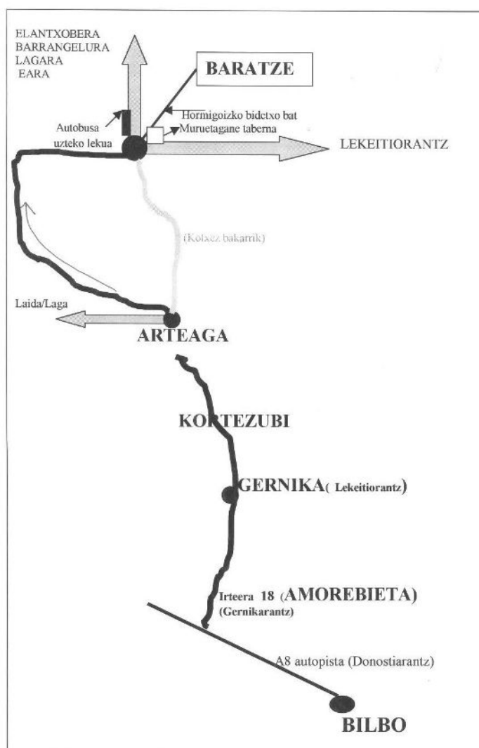
1. irudia: Baratze Baserri-Eskolara heltzeko mapa